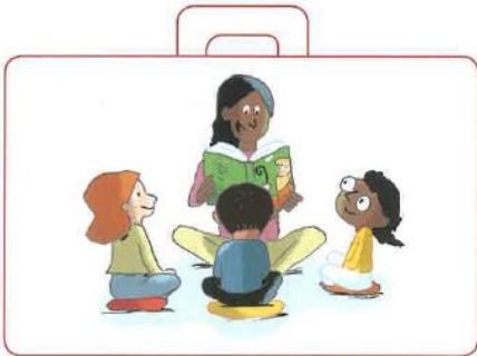
Écouter les histoires qu'on nous lit