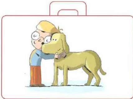
Recevoir un gros câlin de son chien