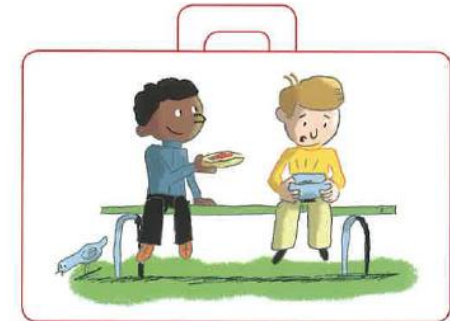
Partager ses tartines, si un ami a oublié les siennes