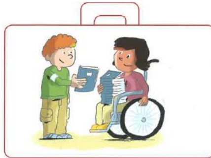
Confier ses livres à un ami pour qu'il les porte