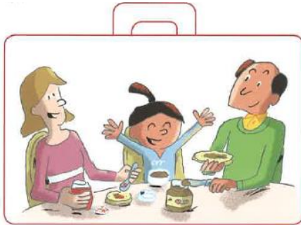
Avoir des tartines préparées par papa et maman

REGARDE les images et COLORIE la poignée de la valise si tu as déjà connu cette situation.