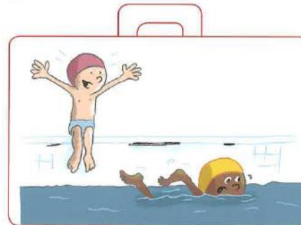
Donner des encouragements à la piscine ou à la gymnastique