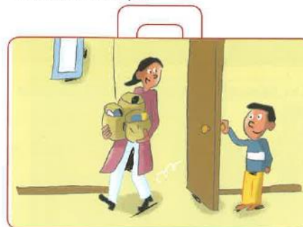
Rendre service aux adultes dans la vie de tous les jours