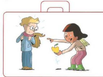
Ramasser les affaires des autres, quand elles tombent