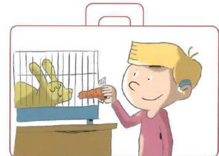
Prendre soin de ses animaux domestiques