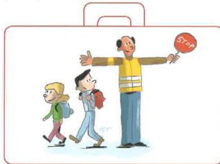
Traverser en toute sécurité grâce à un adulte